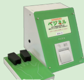
野菜摂取度測定(ベジミル)